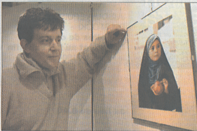
L'émouvant regard de Thierry Robin sur l'Irak. PHOTO GALLEY

Sur les 500 clichés pris sur place, il en expose 22 à Neuchâtel. On y voit des barbelés, un vélo, des regards, des pommes, un lit de torture devenu lit d'accouchement. Mais jamais de misérabilisme. Juste l'envie de montrer les choses telles qu'elles sont. Elles feront réfléchir jusqu'au 7 février. /ACA